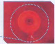
破裂は考えられない 粉々に砕けることがない