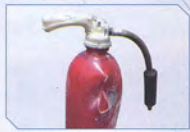
加熱部が局部的に膨張→溶融/火に接触したところのみ損傷

※3：金属製消火器の場合、内圧が上昇してから破裂するため爆風が発生。さらに胴体部分から大きく裂ける上、破断面が鋭利な刃物のようにになっているため、二次災害の可能性がります。