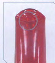
柔軟性があり衝撃が分散 粉々に砕けることがない

落錘衝撃試験の結果、外部衝撃による変形でも容積変化は約86%。それに伴う内圧上昇は約1.1MPaです。つまり、変形による内圧上昇に起因する破損が起こる可能性は、ほとんどありません。